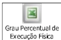
Tabela 5. Grau Percentual de Execução Física